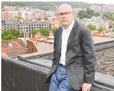
"Quería mostrar que todo pasado es tan malo como el presente"

A fuerza de documentación, mucha biografía de gente de la época y mucha hemeroteca "para ver cómo los periodistas narraban los acontecimientos, de forma bastante moderna he de decir, ahora intentamos edulcorar cierto tipo de noticias", Garrido fue dando con las claves de la novela. "Tenía ya un principio y un final, sólo había que ir armando el grueso de la historia", señala. Quería echar la vista atrás, "ver que las cosas no han evolucionado tanto, que somos hijos de lo que pasó hace un siglo". Y hacerlo en un Bilbao en transformación, "porque nuestra ciudad tiene una fuerza narrativa que no hemos trabajado demasia-